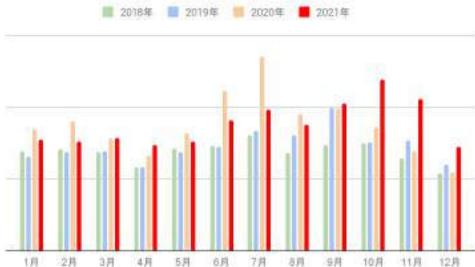
Quick×ワンプライス入札件数