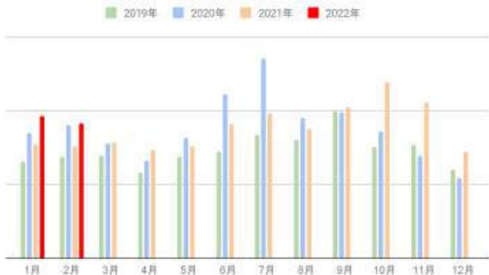
Quick×ワンプライス入札件数