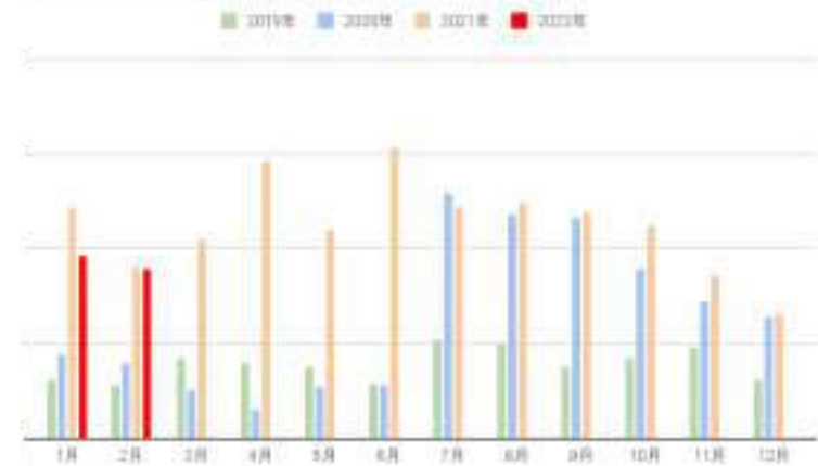
Quick×ワンプライス輸出向け成約台数