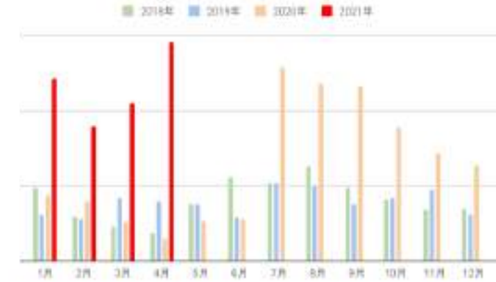
Quick×ワンブライス輸出向け成約台数