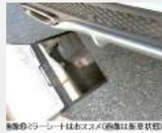
修復歴のコーションは必ずスズ(画像は非車状態)