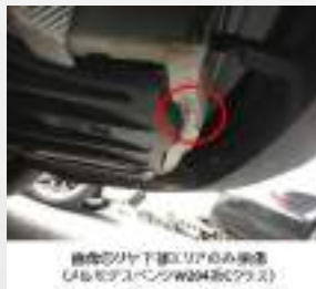
修復歴リヤ下側エリアの画像 (ヒルモジバンW0460272)