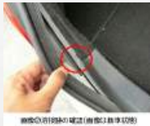
修復歴リヤ下側エリアの画像 (画像は非車状態)