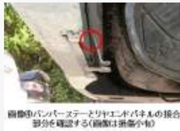
修復歴バンパーステアとリヤエンドパネルの接合部分を確認する(画像は非車状態)