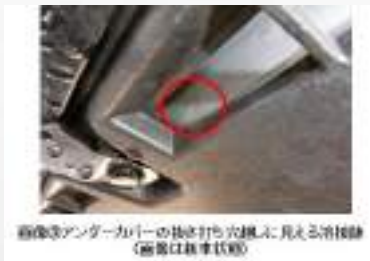
修復歴アンダーカバーの抜き穴が見える画像 (画像は非車状態)

流通している修復歴車の中でフロントエリアに次いで多いのが【リヤエリア】です。このエリアは、車両チェック時にお客様の荷物が荷室に搭載されていたり、雨天時下側からの確認が難しい等、多くの障害が存在します。それでも最低限見ておきたいのが「リヤエンドパネル」。こうした障害がある中、検査員はどのように確認をしているのでしょうか。