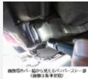
修復歴カバーから見えるバンパーステア部分を確認する(画像は非車状態)