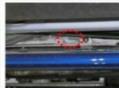
画像⑤裏側に残ったフレーム修正機跡