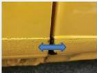
画像②微妙に塗装面が異なっている