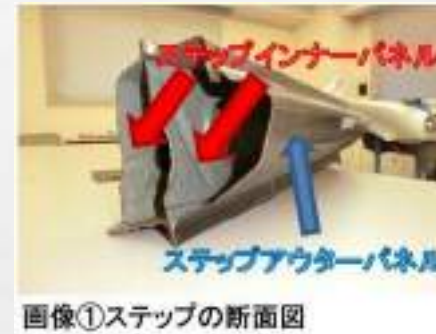
画像①ステップの断面図

サイドエリアに位置するステップは、各ピラーやセンターフロアパネル等の骨格部に隣接しており、修復歴のチェックを行ううえで見過ごせない外板部位となります。それでは検査員は、どのような点に注意してステップをチェックしているのでしょうか。