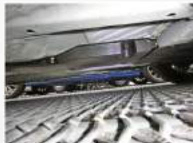
画像④カバー付きでも……