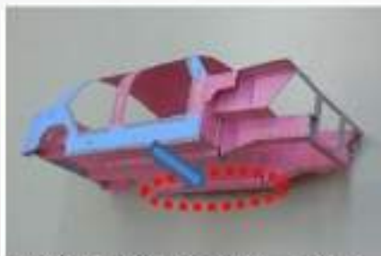
画像③反対側からアプローチする