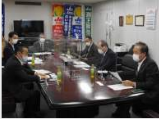
大阪市財政局税務部の担当者がJU大阪事務局に来訪(10月26日、写真右手前が財藤会長)

大阪市は11月2日、2021年度からの商品軽自動車への課税免除実施を発表した。一部を除く軽自動車などが対象で、販売目的で取得した、いわゆるナンバープレート付きの展示車両が対象。大阪府下では、43市町村のうち34市町において軽自動車税の課税免除に関する条例が存在するものの、現状実施されているのは河内長野市と箕面市のみ。今回の大阪市での実施決定を受け、他市町村への波及にも期待感が高まるどころだ。