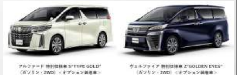
アルファード 特別仕様車 S“TYPE GOLD” (5700cc・2WD) <オプション装着車>